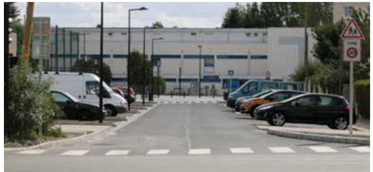
Rue Louis Aragon : réaménagement de la rue Louis Aragon avec réfection et création de voiries et de places de stationnement. Créations d'espaces publics.