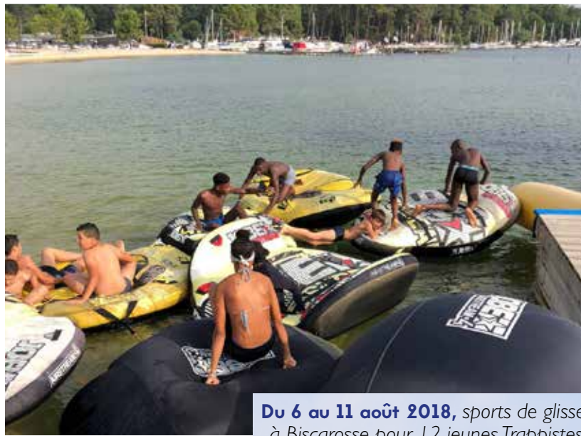
Du 6 au 11 août 2018, sports de glisse à Biscarosse pour 12 jeunes Trappistes.