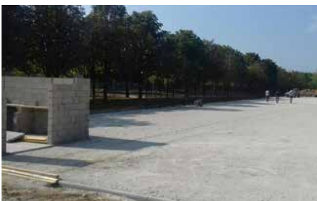
Création d'un pas de Tir à l'arc dans le complexe sportif Jacques Monquaut.