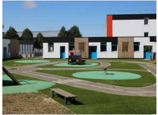
Groupe scolaire J.-B. Clément : installation de l'ascenseur, création de deux classes, réfection des sols des cours, et création d'un accueil de loisirs.

Cet été plusieurs chantiers ont concerné la voirie et les équipements municipaux. Essentiellement réalisés dans les écoles, mais également à la Maison de la petite enfance ou encore à l'Hôtel de ville, ces travaux permettent d'améliorer le cadre de vie de tous les Trappistes. Retrouvez en images une sélection de chantiers de l'été et rendez-vous sur www.trappesmag.fr pour en savoir plus.