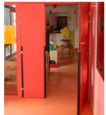
Crèche Fanny Dewerpe : réhabilitation de la salle de restauration, installation de nouveaux robinets, création d'une ouverture et réfection du sol des jeux extérieurs.