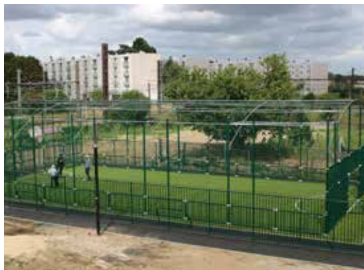
Installation du city stade des Yvelines , rue Jean Zay.