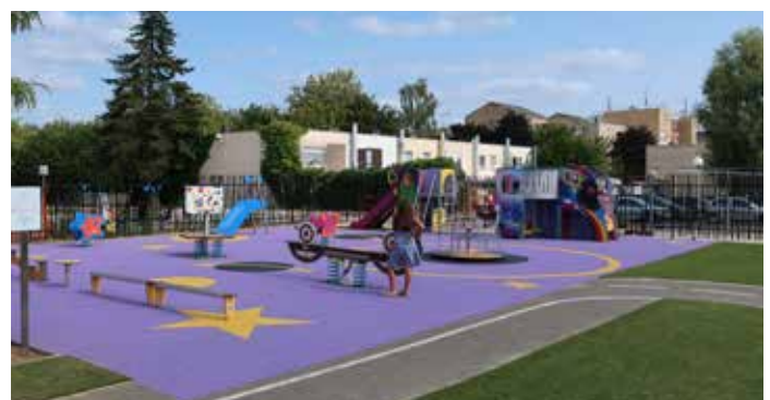
Square Montaigne : création de jeux dans la cour de l'école maternelle ainsi qu'une voirie avec places de stationnement et aménagement d'un espace vert.