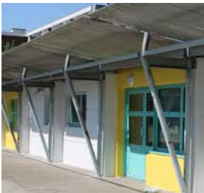
Groupe scolaire Jean Cocteau : ravalement des bâtiments et création d'une salle d'activité.