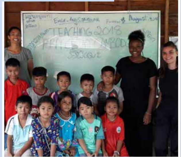
Du 4 au 19 août 2018, séjour de volontariat dans la ville de Samraong au Cambodge.

RETROUVEZ TOUT L'ÉTÉ DE TRAPPES-EN-YVELINES EN IMAGES : sorties, séjours, stages, Trappes plage... sur trappesmag.fr