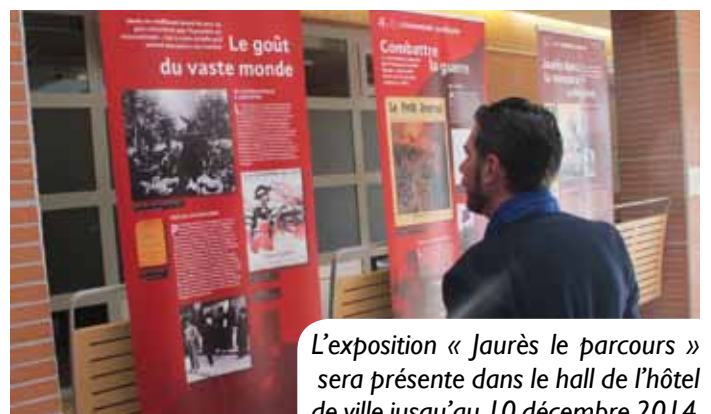
L'exposition « Jaurès le parcours » sera présente dans le hall de l'hôtel de ville jusqu'au 10 décembre 2014.

ment intéressée. J'ai voulu réaliser une sculpture à l'échelle humaine, un Jaurès qui soit parmi les habitants, proche des usagers de la mairie. Le socle permet de s'asseoir près de l'homme qui s'est opposé à la guerre, l'homme visionnaire, d'habiter la place Jean Jaurès. »