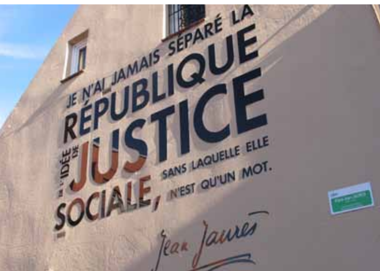
La citation de Jean Jaurès est inscrite sur la façade, place Jaurès, non loin de l'œuvre de bronze du sculpteur Jean-Charles Mainardis.