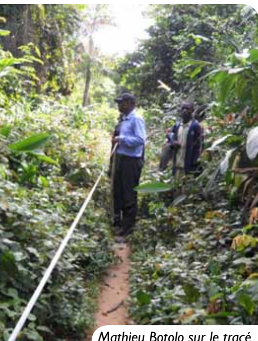
Mathieu Botolo sur le tracé de la future route.

La voie fluviale reste la seule alternative pour assurer le déplacement des biens et des personnes. Afin d'ouvrir l'accès au fleuve à un peu plus de 5 000 habitants regroupés dans treize villages, la construction d'une route de 4 kilomètres est nécessaire. « Nous avons fait appel à la main d'œuvre locale. Plus d'une centaine de personnes sera ainsi employées. Le choix de matériaux écologiques participe à des méthodes de mises en œuvre innovantes. Ce projet 2 génère ainsi un impact économique, sociétal et environnemental positif et durable », assure Mathieu Botolo, président de Soleil du monde. Enfin, ce projet de co-développement favorisera un échange culturel entre notre ville et le territoire de Monkoto. Les travaux ont débuté en début d'année pour une durée de trois ans.