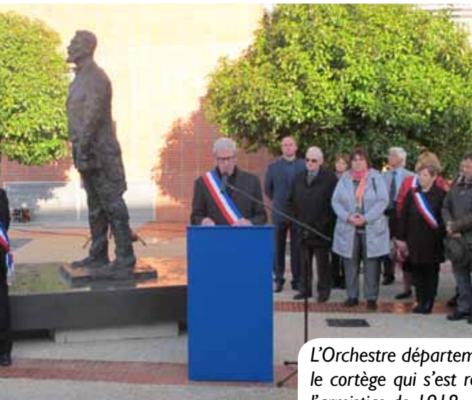
L'Orchestre départemental des pompiers a ouvert le cortège qui s'est rendu au monument aux Morts, place Mgr Roméro, pour le 96 e anniversaire de l'armistice de 1918. Après les discours officiels et la lecture de lettres de poilus par des élus du Conseil des Jeunes, la Maîtrise de Trappes-en-Yvelines a interprété « Au nom des enfants » de Anton Dvorak.