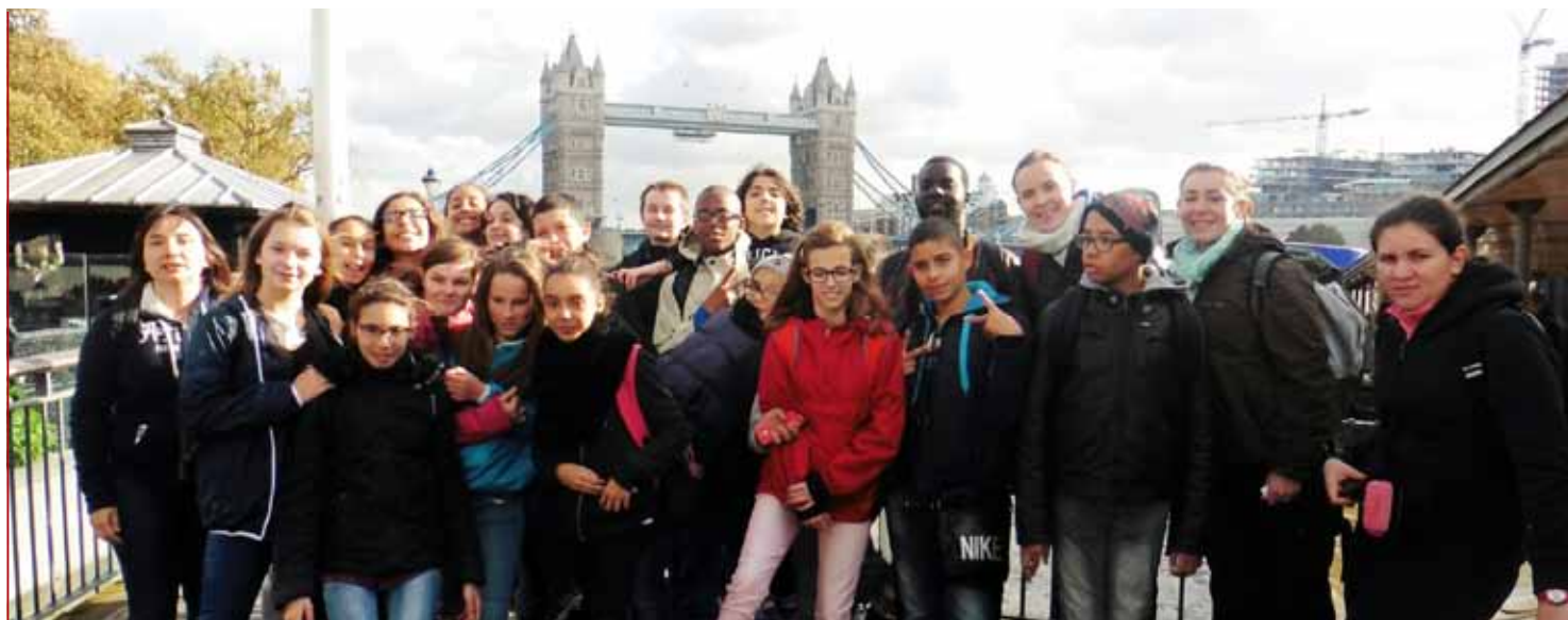
Vingt jeunes ont découvert Londres pendant les vacances d'octobre. Au programme : promenade, musées, croisière sur la Tamise et shopping. Du 20 au 23 octobre, ils ont été accueillis dans des familles. L'occasion de perfectionner sa connaissance de la langue anglaise.