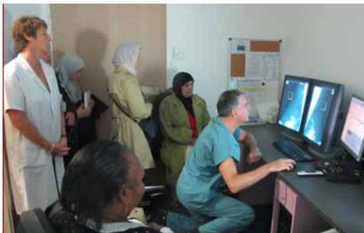
À l'invitation des centres socioculturels, des femmes ont visité le service «mammographie» de l'Hôpital privé de l'ouest parisien dans le cadre d'« octobre rose », un mois pour faire avancer le dépistage du cancer du sein.