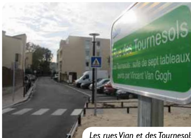
Les rues Vian et des Tournesols ont été restructurées pour permettre leur jonction.

le « pacte financier », un retour vers les villes d'une partie des recettes produites par leur développement, est en cours de discussion.