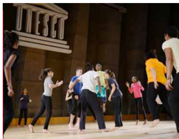
Un groupe de quinze Trappistes a dansé à l'Unesco samedi 8 novembre à l'occasion du centième anniversaire de l'association American Field Services. Ils avaient déjà travaillé ensemble lors du spectacle Dancing To Connect présenté en avril à la Merise.