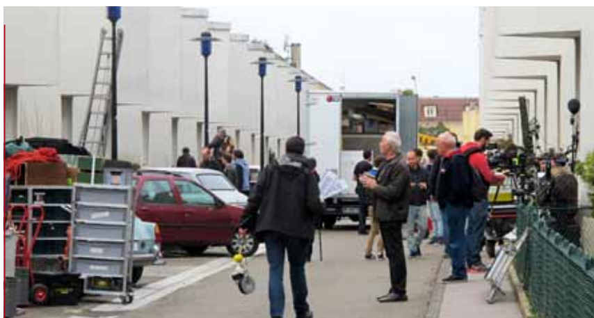
Les caméras de la chaîne Arte étaient installées aux «Dents de Scie», lundi 20 octobre, pour le tournage d'une séquence de Trepalium, une ambitieuse série d'anticipation ancrée dans le réel. La cité labellisée « Patrimoine du XX e siècle » avait déjà été choisie en 2012 par Léos Carax pour son film Holly Motors.