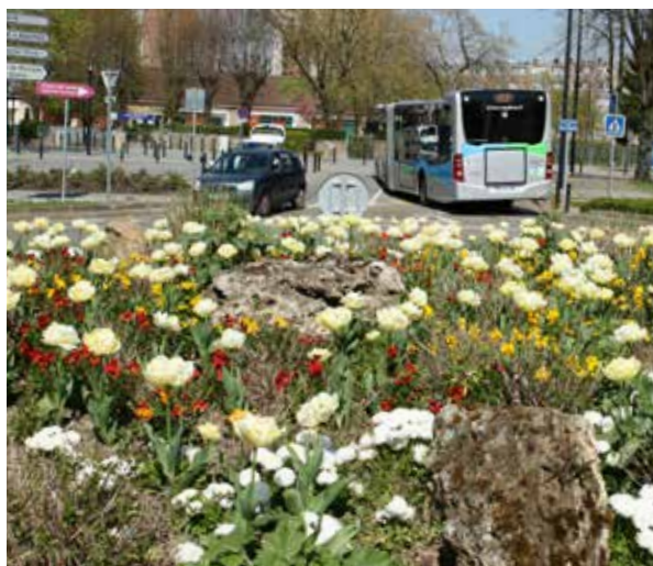
Tulipes, giroflées, pensées, pâquerettes et myosotis : les fleurs bisannuelles fleurissent la ville.