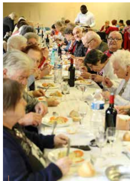
Le 16 mars, 90 personnes se retrouvent lors du repas mensuel à la Maison des Familles.

Jeudi 7 : visite guidée de la brasserie artisanale de Marcoussis et dégustations.