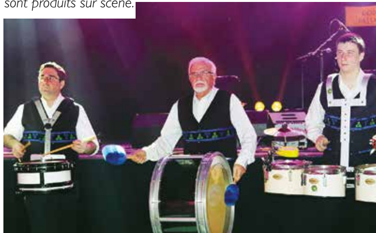
Samedi 2 avril : plus de 400 personnes participent au Fest Noz à La Merise. La soirée organisée par l'association Seiz Avel est marquée par la haute qualité des groupes qui se sont produits sur scène.