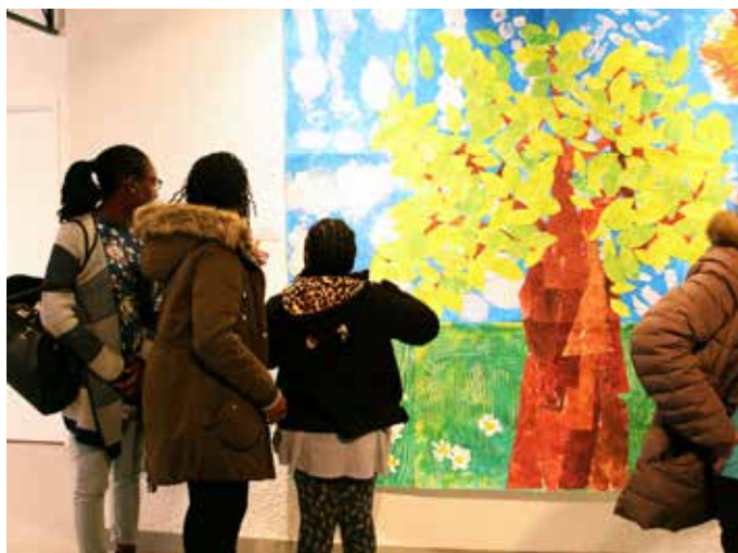
Jeudi 17 mars : les œuvres du peintre Gilles Guias et celles créés par les élèves de la ville sont présentées lors du vernissage de l'exposition « Les choses importantes », à la galerie Le Corbusier.