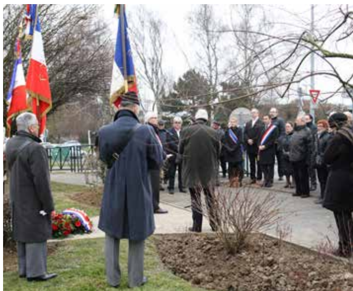
Samedi 19 mars : recueillement lors de la commémoration du 19 mars 1962, sur la place du même nom.