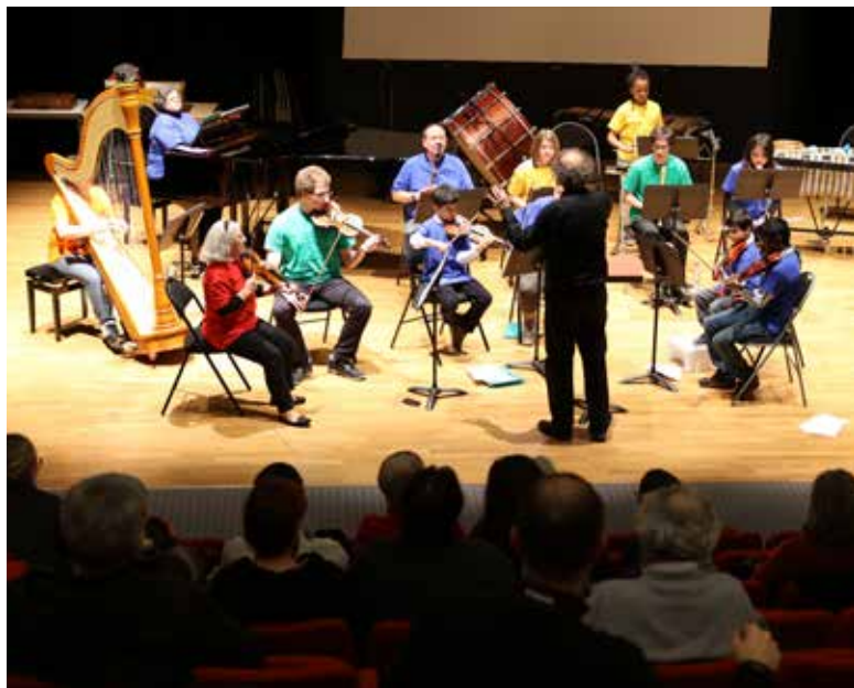
Samedi 19 mars : les scientifiques musiciens de l'INRA Ile-de-France et du Synchrotron Versailles se joignent aux élèves de l'École de musique et de danse lors du concert Art et Sciences.