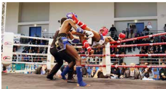
650 spectateurs encouragent les boxeurs lors du gala de boxe MuayThai le samedi 16 avril au complexe sportif Paul Mahier.

Mercredi 1 er juin, les Fitdays reviennent sur le parking de la mairie pour faire découvrir le triathlon aux enfants avec de la natation, du vélo et de la course. Le matin est réservé aux scolaires mais de 16h à 18h, le village des enfants est ouvert à tous de 5 à 12 ans gratuitement. Avec le relais des familles, de 18h à 19h30, parents et enfants peuvent participer en duo en natation et en course. Pour participer, préinscrivez-vous sur le net sur www.fitdays.fr/trappes .