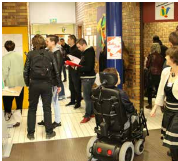
Mercredi 13 avril : près de 400 personnes profitent du Forum jobs d'été pour déposer des candidatures ou participer à des ateliers, à la Périssphère.