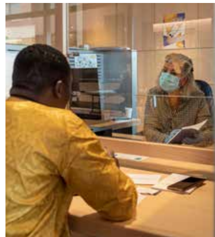
Accueil des usagers par l'Etat-civil.