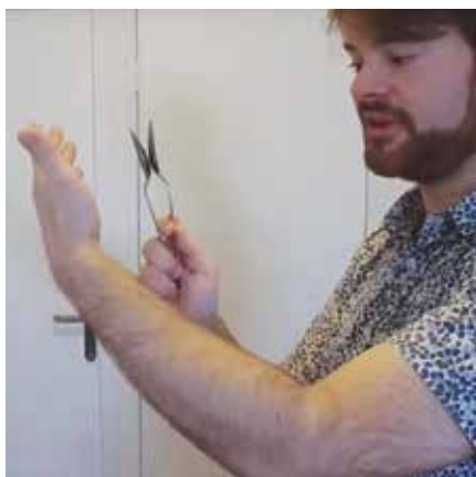
Premier cours de base : comment tenir les cuillères suivant 2 méthodes.