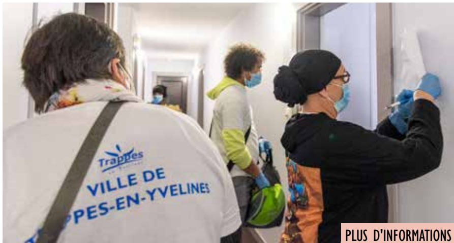
Distribution des masques dans les logements.