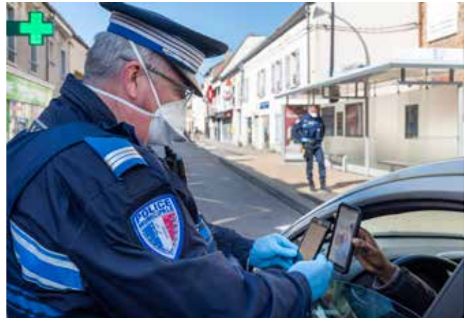
Contrôle d'attestations de dérogation de sortie par la Police municipale.

A la demande du CCAS, le service a fourni et monté une tente pour le secours populaire le 6 avril.