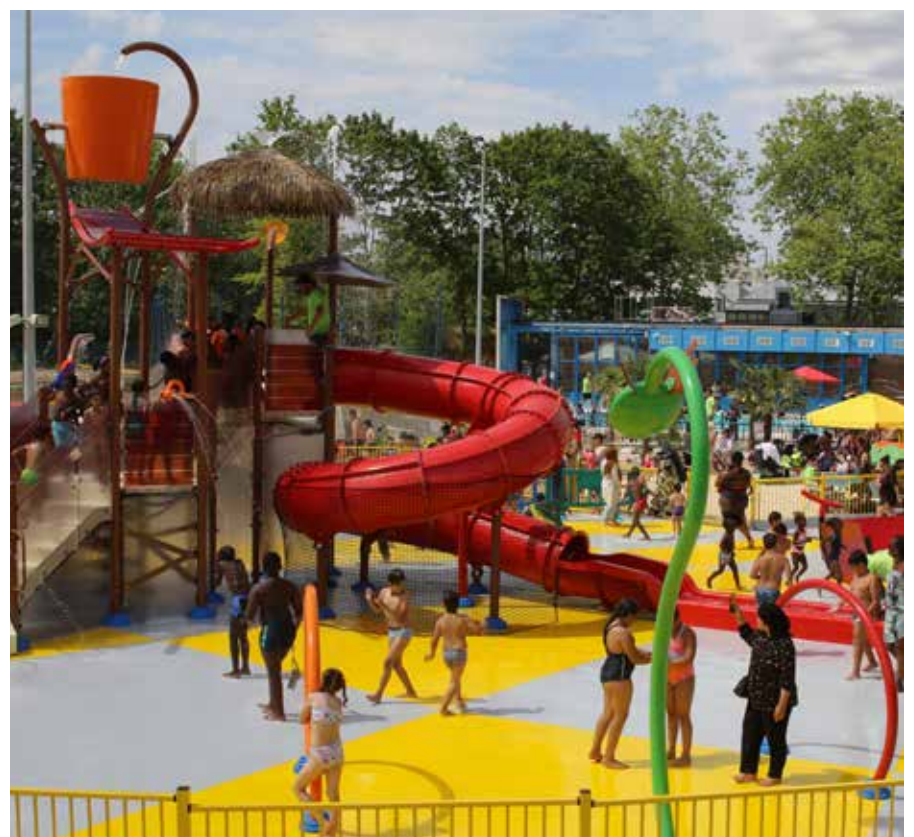
Pour un accueil de tous dans les meilleures conditions