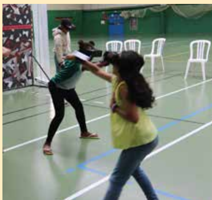
Activité E-sport en accès libre, à l'abri des fortes chaleurs.

Les Trappistes ont aussi pu profiter d'autres nombreuses activités : olympiades sportives et culturelles, E-sport, cinéma plein air, sorties à la journée... Pour d'autres, leur temps libre a été mis au service de la ville tout en découvrant le mode professionnel avec "mon 1 er job"