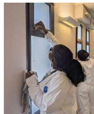
Nettoyage après peinture du dortoir de la maternelle Jaurès