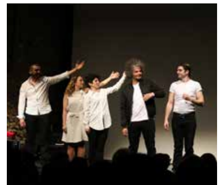
Convention pluriannuelle avec Déclic théâtre