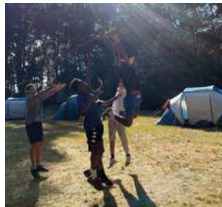
Séjour à la Trinité-sur-Mer pour les 11/13 ans et 14/17 ans