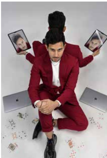
French Twins le dimanche 10 septembre 2023

PROGRAMME COMPLET DISPONIBLE DANS LES BÂTIMENTS MUNICIPAUX SUR TRAPPES.FR RÉSERVATIONS LAMERISE.COM