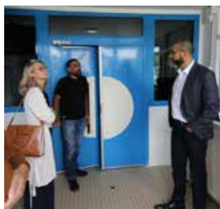
La nouvelle entrée de l'école Louis Aragon