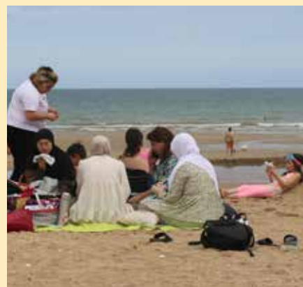
Six journées à la mer à Ouistreham et à Villers-sur-Mer proposées aux familles Trappistes.