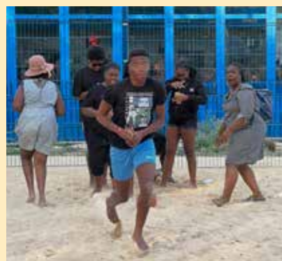
Soirée à thème "Kermesse" à La Plage.