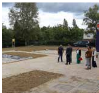
La future cour élémentaire Jean Macé

En plus des interventions du quotidien, pour de petits travaux courants ou régler un souci urgent, il faut également programmer des interventions plus lourdes. Avec l'absence prolongée des enfants comme des équipes pédagogiques, les vacances d'été sont le moment idéal !