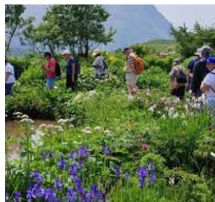
Séjour seniors à Montgenèvre