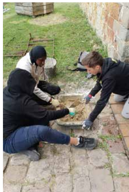
Les séjours volontariat sont l'occasion de découvrir et s'évader tout en apportant sa participation active à un projet. En Roumanie pour les 18/25 ans (à gauche) et au château de Ham dans la Somme pour les 14/17 ans (à droite)