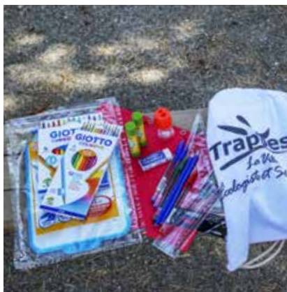
Le kit comprend des fournitures de qualité essentielles à l'apprentissage

Il a été conçu pour répondre à leurs besoins académiques, favoriser leur créativité et les aider à s'épanouir dans leur apprentissage et a été distribué le 4 septembre .