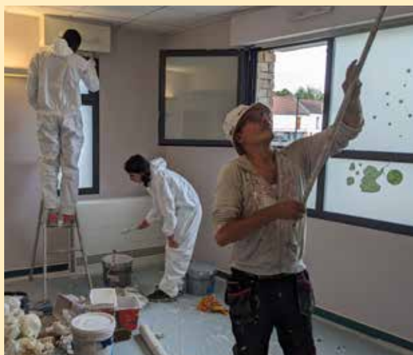
Pendant qu'une grande partie de la jeunesse trappiste profitait des vacances, 110 jeunes ont pu découvrir le monde professionnel dans les 29 chantiers "Mon 1 er job" organisés par la Ville. Encadrés par des professionnels, ils ont participé à la rénovation et l'entretien de bâtiments par des tâches simples (peinture, nettoyage...), fait de la sensibilisation au tri, aidé les Atsem dans la préparation des écoles pour la rentrée ! Dans le cadre de la rénovation en cours du square Pergaud, 6 jeunes ont également rénové la sculpture du bateau qui réintègrera le futur paysage du quartier. Après 4 jours d'activité et d'initiation au monde du travail, c'était le moment de la première paye, et du premier bulletin de salaire !