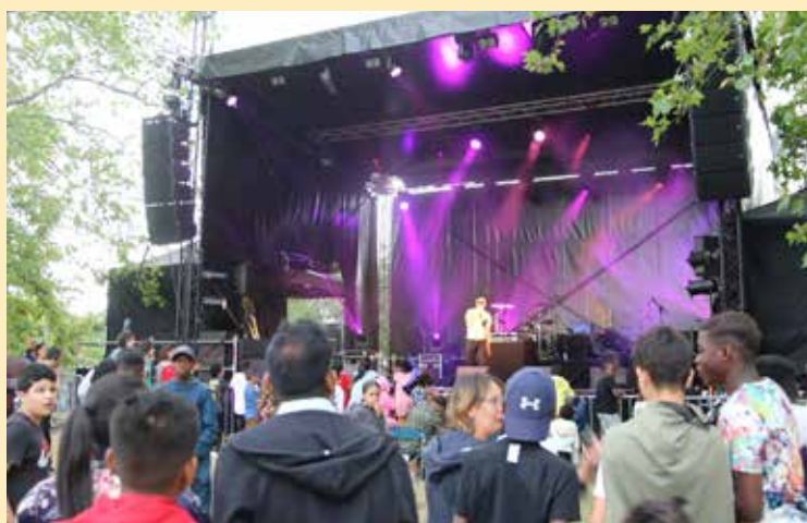
Jeudi 13 juillet : la fête nationale, une belle occasion pour les Trappistes de se réunir et se retrouver autour de plusieurs scènes musicales. La soirée a été couronnée par le traditionnel feu d'artifice.