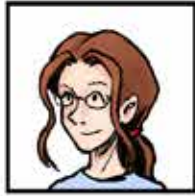
Delphine La maman