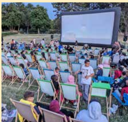
Les séances de cinéma en plein air se sont succédé, avec la programmation de 5 films où les héroïnes étaient à l'honneur.