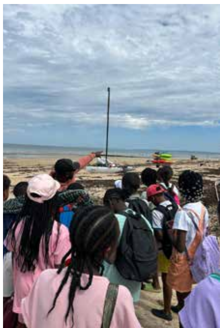
Séjour à la Lion-sur-Mer pour les 6/7 ans