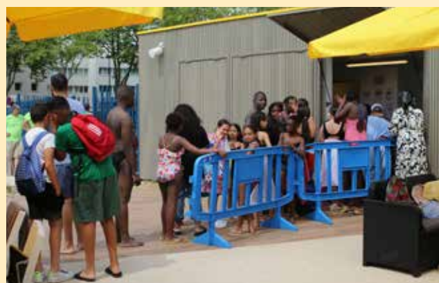
Les associations tenaient à tour de rôle la buvette pour rafraîchir et restaurer les baigneurs et leurs familles.