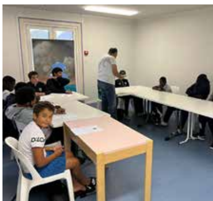
Séjour remobilisation pré-rentree pour les 10/14 ans