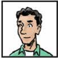
Kader Le papa