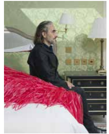
Stephan Eicher le samedi 27 janvier 2024

Dimanche 10 septembre, La Merise ouvrira sa saison et ses portes à 15h !