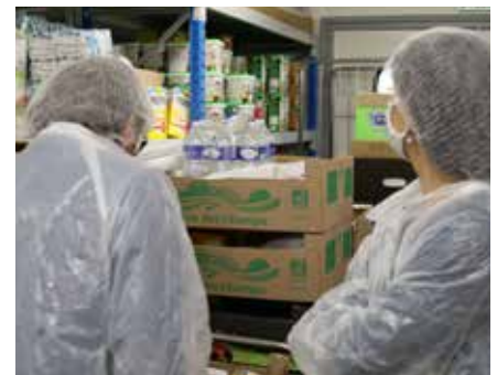
Cuisine centrale "Les Marmitons"

Prochain conseil municipal : lundi 2 octobre à 18 heures. Salle du conseil à l'Hôtel de Ville